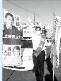
8月5日朝・街頭で訴える

今求められる政治は、非正規雇用を可能な限り正規雇用に変え内部留保ではなく労働分配率を上げる政策が必要です。また、現在の株式等金融資産所得への課税は、他の所得と分離し一律20%で累進課税にはなっておらず、お金持ちほど恩恵があります。他の所得と合算をして累進税率の適用をすべきです。そして困窮する方々へのセイフティネットの財源に充てるべきです。