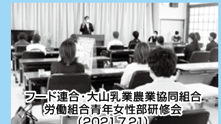
フード連合・大山乳業農業協同組合 (労働組合青年女性部研修会 (2021.7.21)