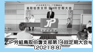
JP労組鳥取(伯耆支部)第14回定期大会 (2021.8.8)