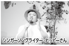
※問い合わせ先/東部地域協議会

今年の中央(東部)会場で「歌で原爆を伝え語る」と題したりモータライブを予定していたシンガーソングライターのヒッピーさんより、メッセージと歌を収録し送っていただきました。構成組織で「平和学習」の器材(DVD)としてご活用いただければ幸いです。