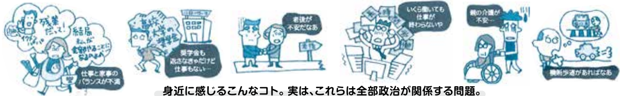
身近に感じるこんなコト。実は、これらは全部政治が関係する問題。